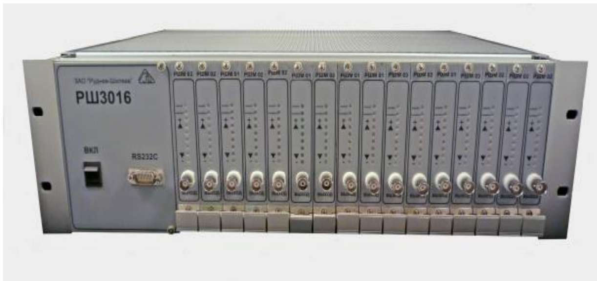
Рис. 2.1. общий вид

Общий вид платы РШ представлен на рисунке 2.1